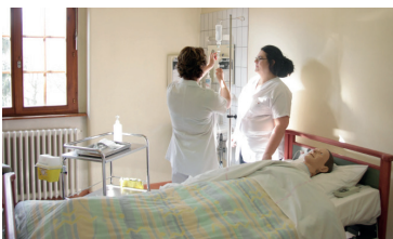
Plateau de formation clinique et technique

Salles équipées multimédias Salle informatique Plateau de formation clinique et technique Salle de pause Accès aux personnes à mobilité réduite